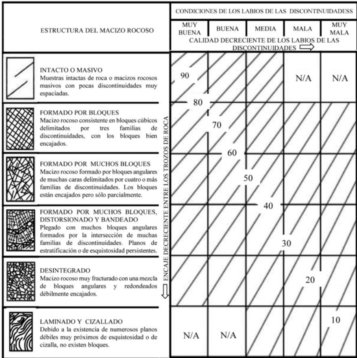
Tabla para estimar el índice GSI.